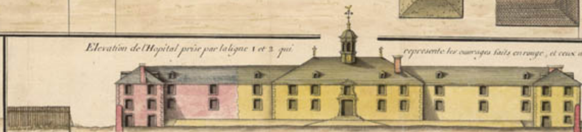
représente les ouvrages faits en rouge, et ceux à faire en jaune